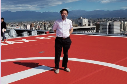
岡崎が提案した屋上ヘリポート

問 全国的にも最新の設備を備えた防災危機管理センターの供用を開始するが、センターの機能を最大限活かすには、災害時のトラブルシューティング対応のための専門人材の配置が必要。