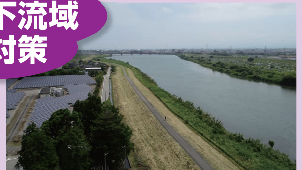
神通川左岸:整備前(令和3年5月)