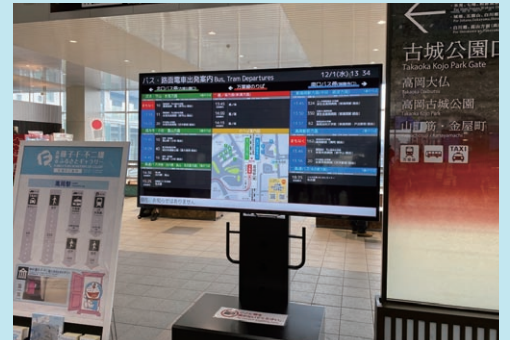
高岡駅のデジタルサイネージ