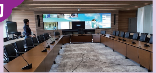
常時災害対策が可能な本部

電気設備は2系統で受電し、2系統とも停電した場合は非常用発電機が自動で起動する仕組みとなっている。このほか給排水については、3日間は機能維持ができる受水槽を備えているほか、給水ポンプも3台設置しバックアップが可能であるなど、災害時の機能維持に万全を期している。電気、給排水等の設備の保守については、県庁に5名の保守員が常駐し、設備の操作及び日常点検と簡易な修繕を行っており、庁舎管理を行う管財課には、電気、機械の技術職3名が配置されている。万一に備え、センターの非常用設備の動作確認や、非常用発電機を月1回試運転するなど、非常時の対応の訓練を定期的に行うとともに、 突発的なトラブルが生じた際は、保守員と管財課の技術職員が連携して対応することとしている。 それでも対応できない場合は、高度・専門的な知識・技術を有する専門業者に対応を依頼し、センターの早急な機能回復を図る体制を構築している。