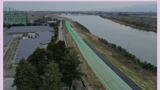
神通川左岸:整備後(令和4年5月)